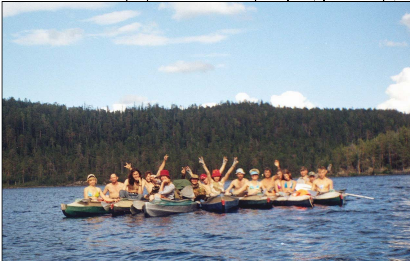
Фото 13. 25 июля. На озере Кукас