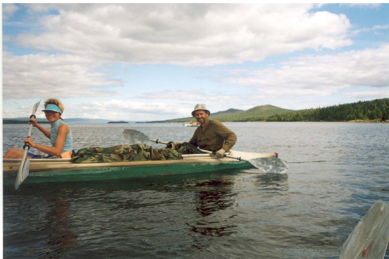
Фото 28. 4 августа. Последний переход. Губа Княжая, остров Крестовый, гора Крестовая.

Более 1000 фотографий и видео есть на прилагаемом к отчету диске. Посмотрите.