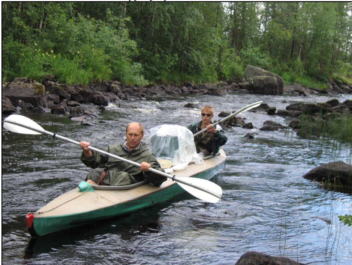
Фото 7. 20 июля. Река Нульзерка.