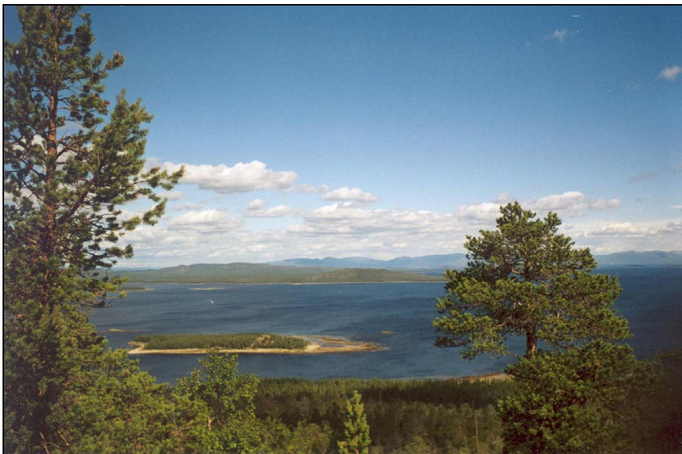
Фото 27. 4 августа. Вид на остров Крестовый с горы Крестовая.