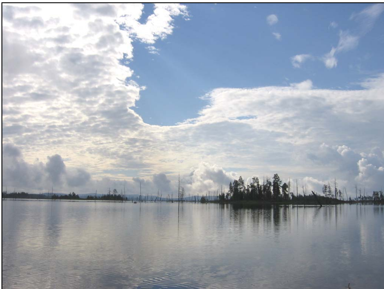
Фото 14. 26 июля. На озере Кундозеро (Кумское вдхр)