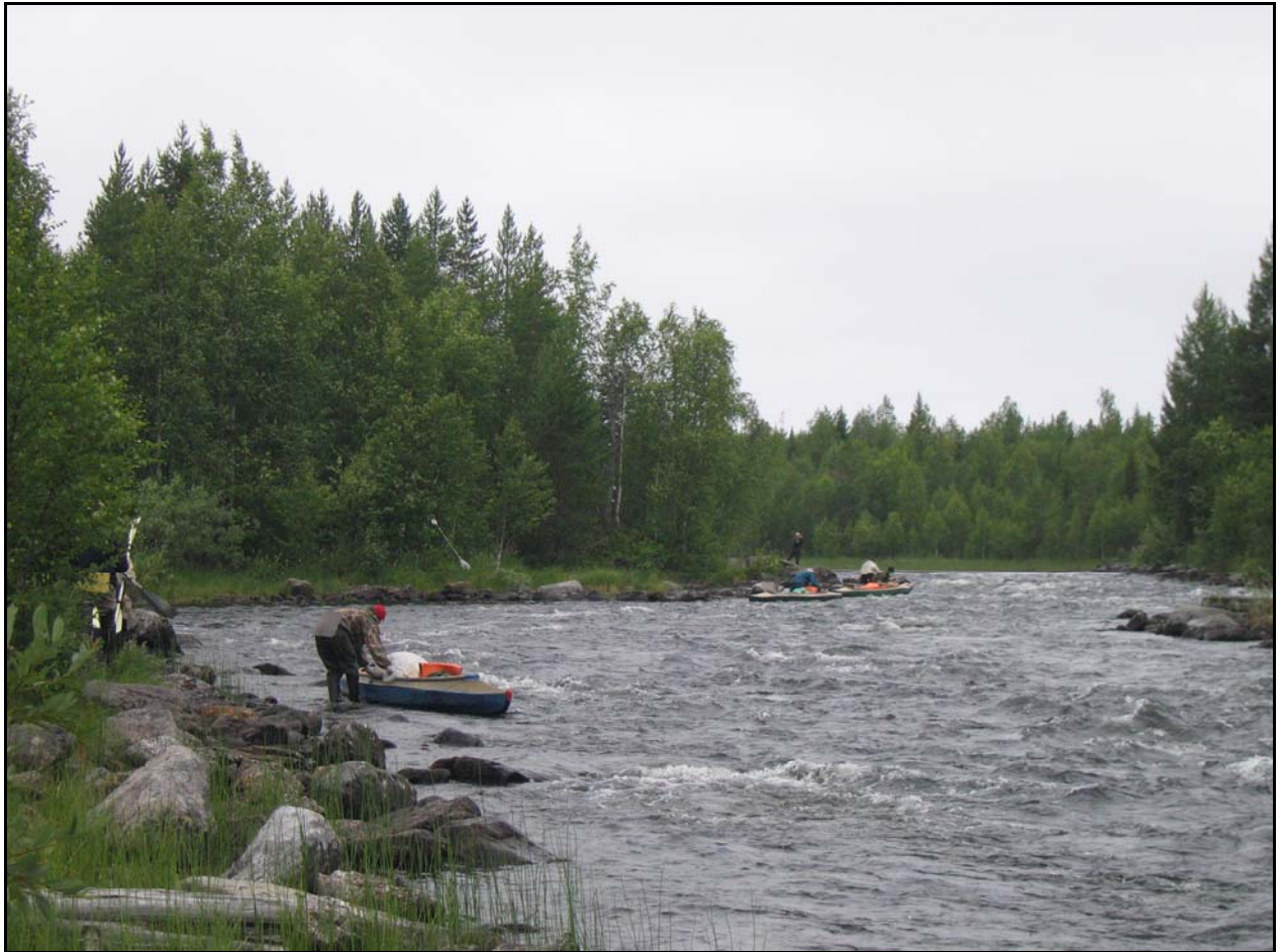
Фото 9. 21 июля. Проводка вверх по р.Винча, вид вверх по течению.