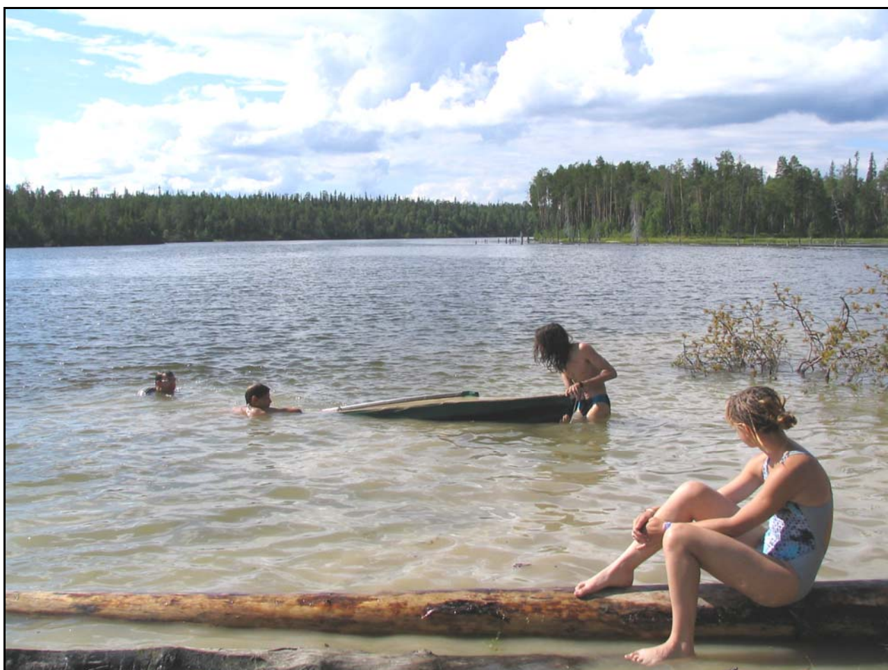
Фото 16. 27 июля. Дневка в устье р.Невга. Вода теплая.