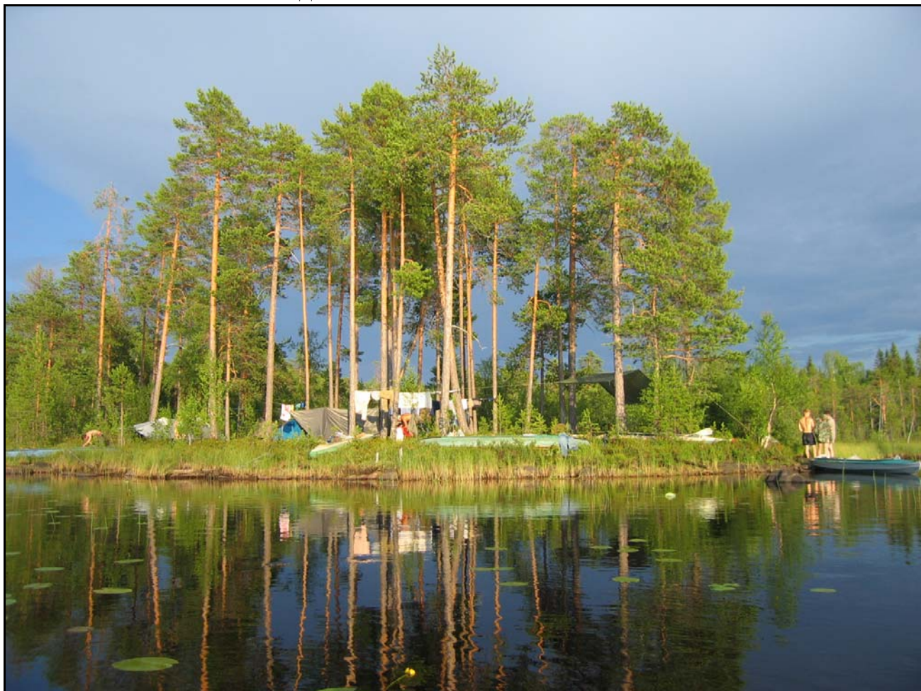
Фото 5. 19 июля. Место ночевки 2 (хорошее).