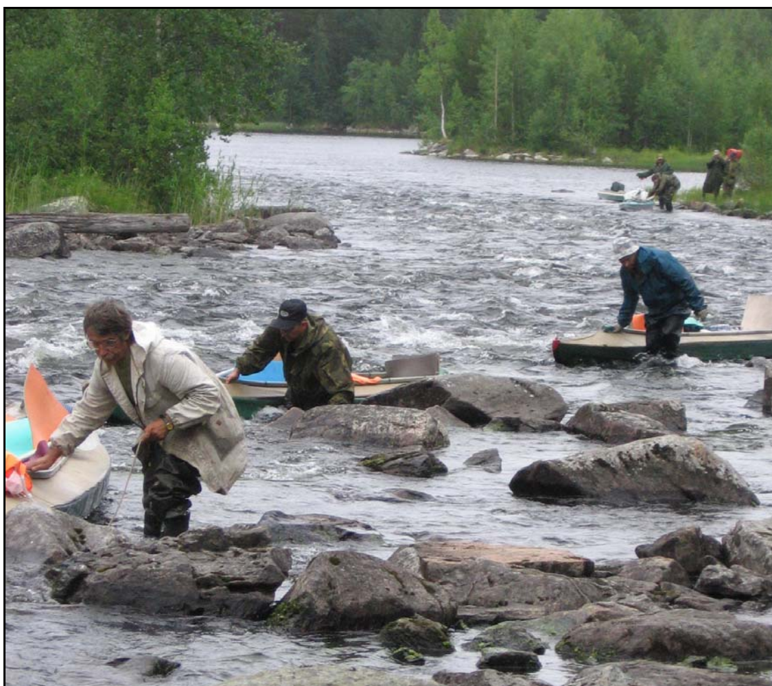
Фото 8. 21 июля. Проводка вверх по р.Винча, вид вниз по течению.