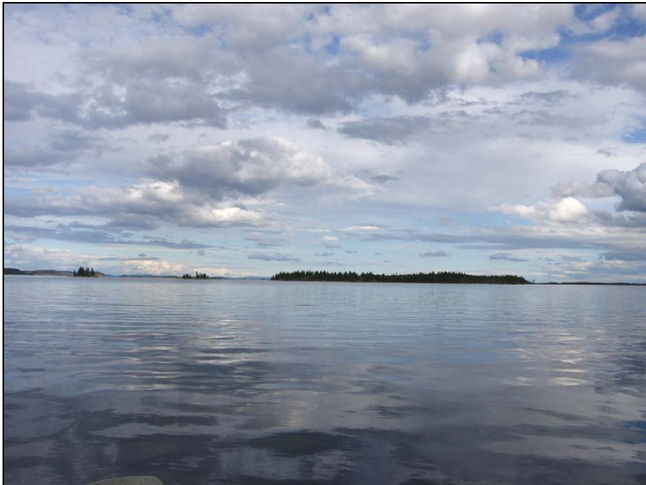
Фото 22. 31 июля. Князегубское вдхр., острова Олены.