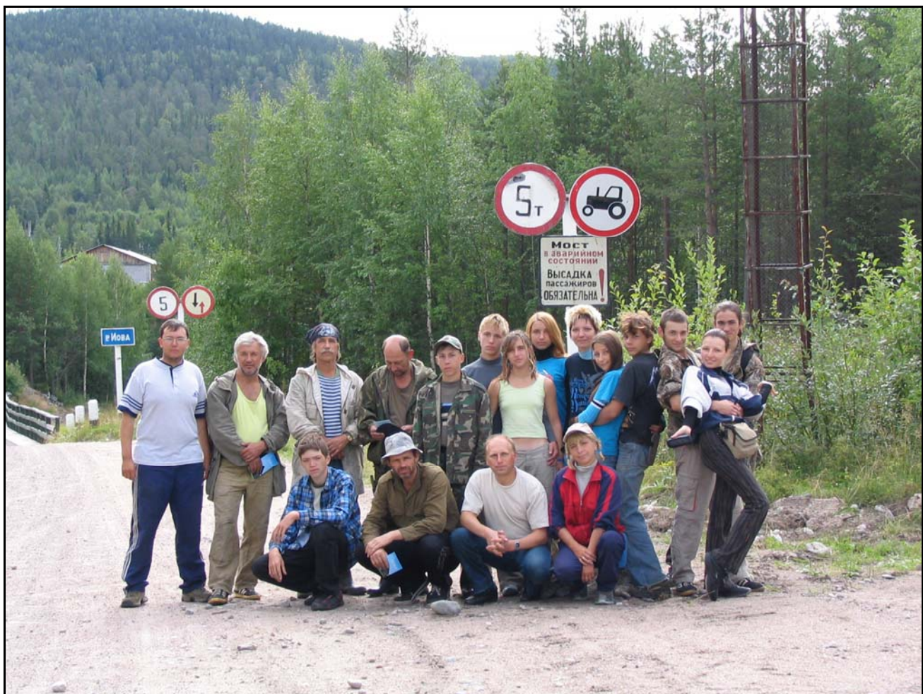
Фото 21. 31 июля. Группа у моста на р. Иова в пос. Зареченск.