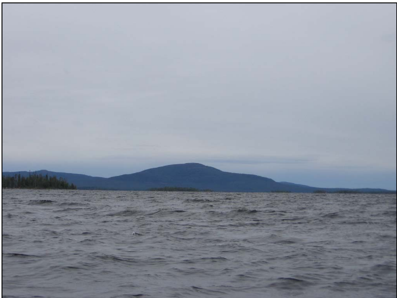
Фото 23. 1 августа. Остров Большой Петин, вид с места ночевки 15 (о-ва Ягодные).