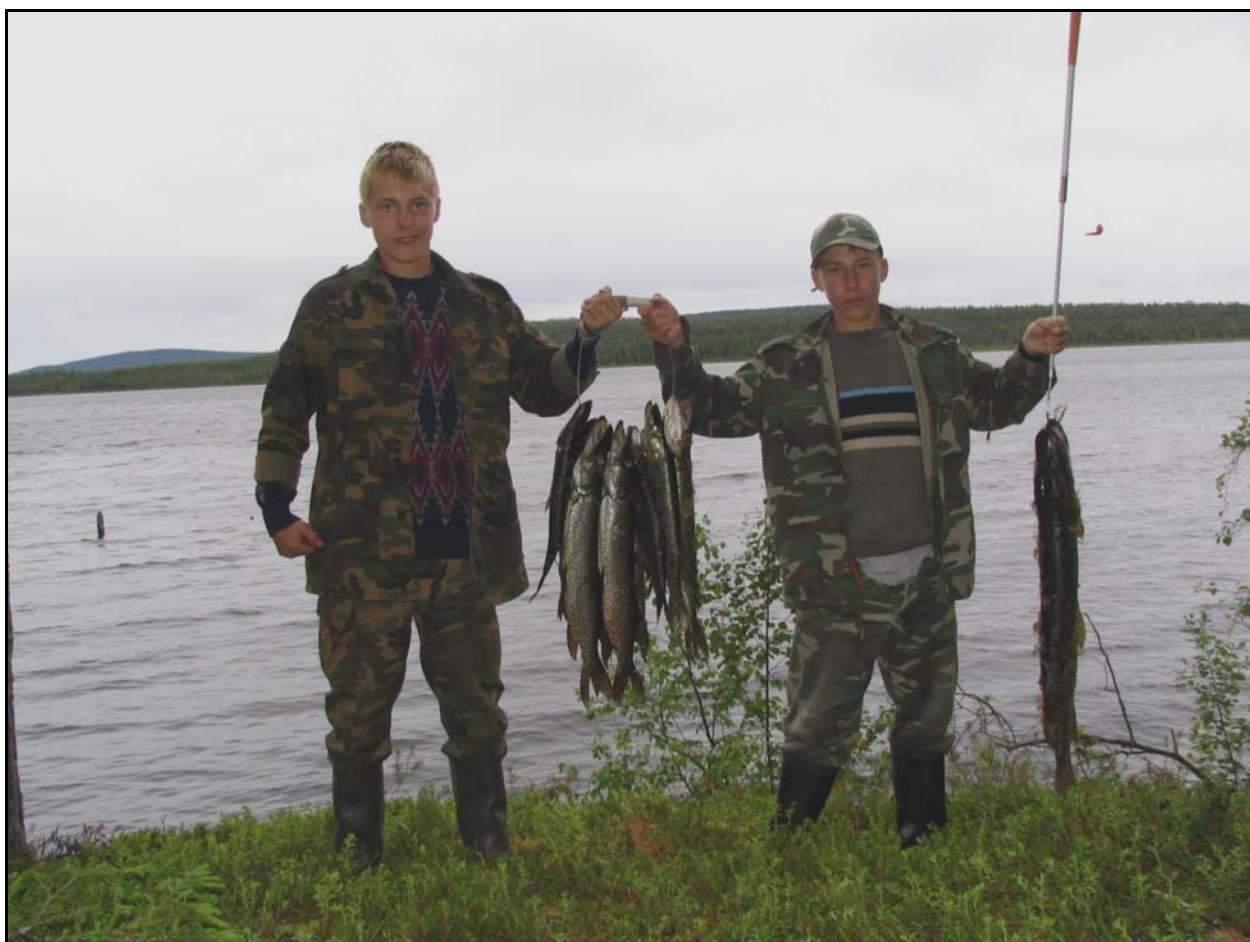
Фото 18. 28 июля. Губа Сом. Удачная рыбалка (щука, язь). Ветер и волна усиливаются.