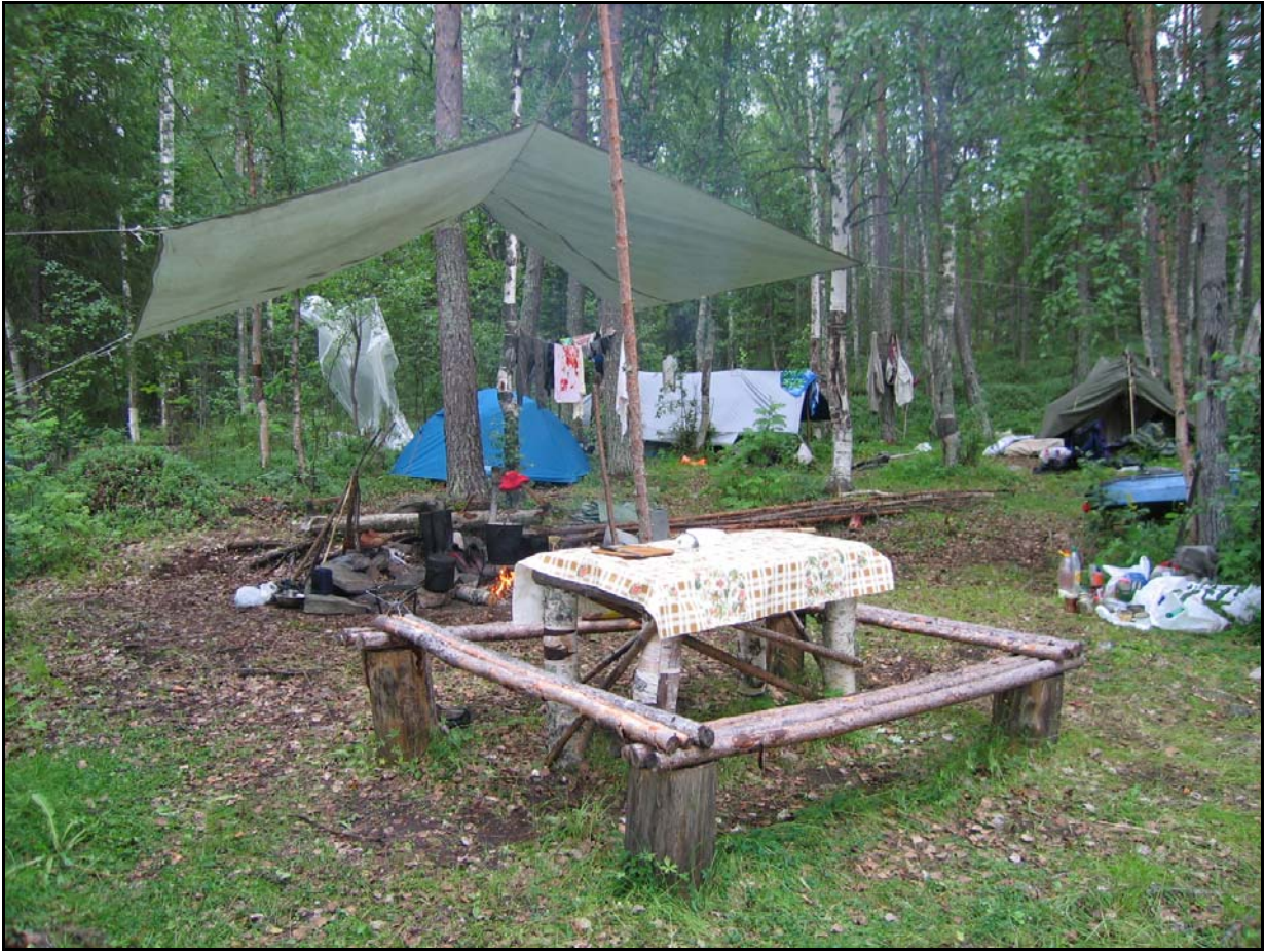
Фото 11. 22 июля. Место дневки и бани