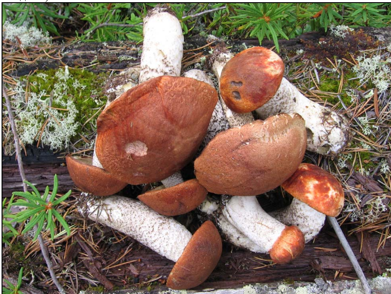
Фото 24. 2 августа. О. Лайдасалма. Подосиновики. Бывало и намного больше.