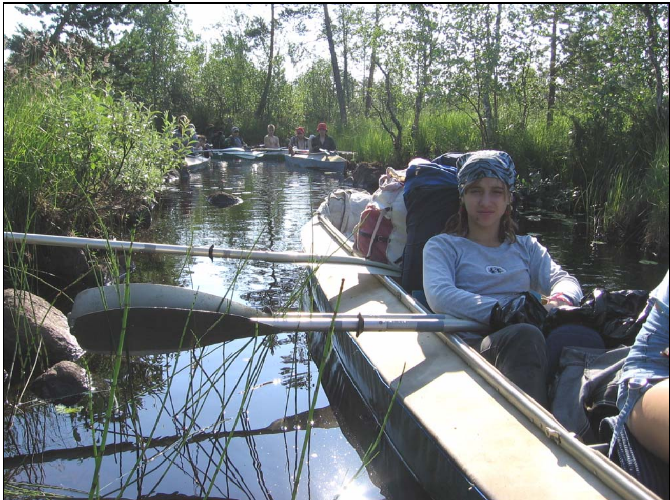
Фото 3. 19 июля. Протока кончилась, дальше волок