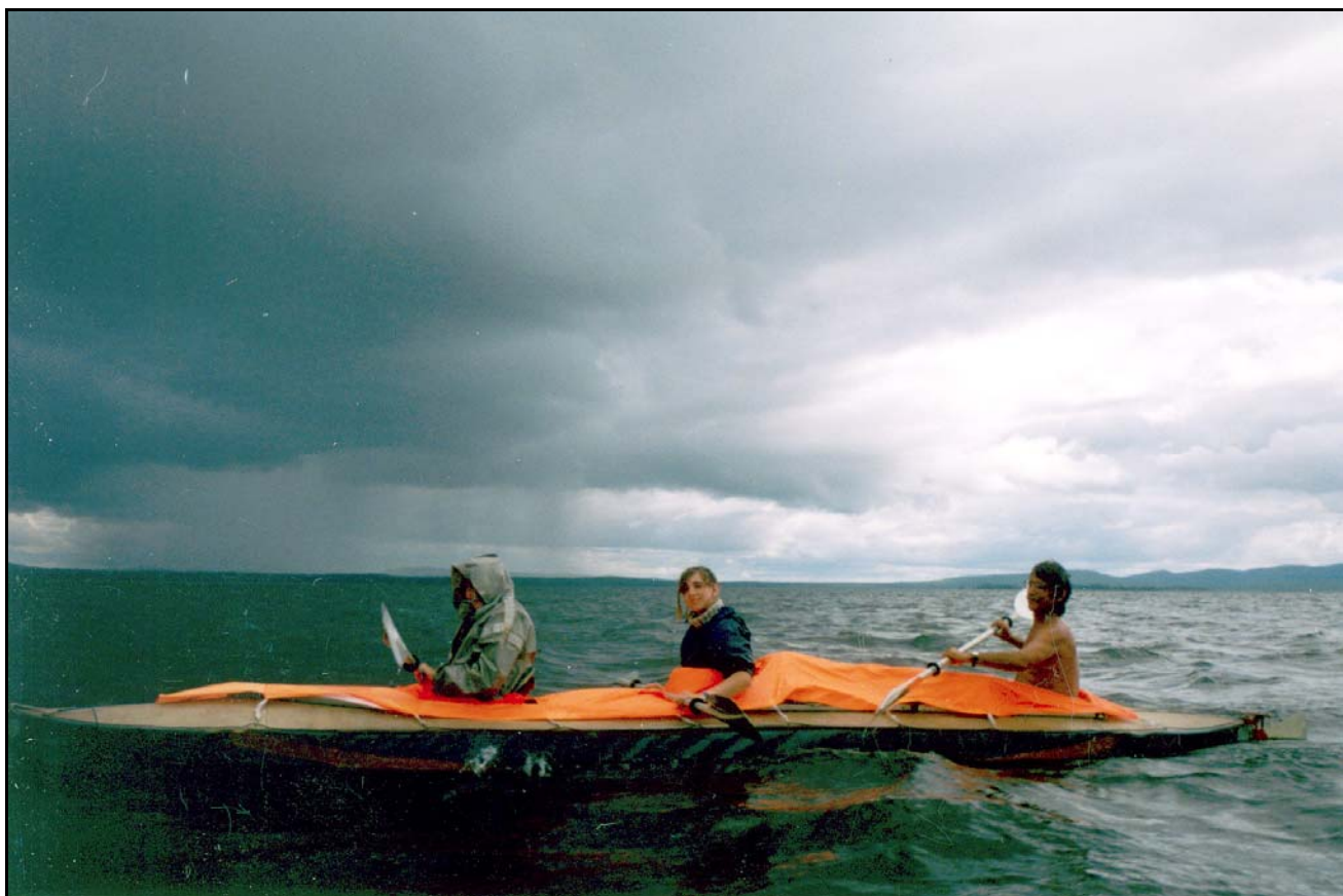
Фото 19. 29-30 июля. Сложный ночной переход.