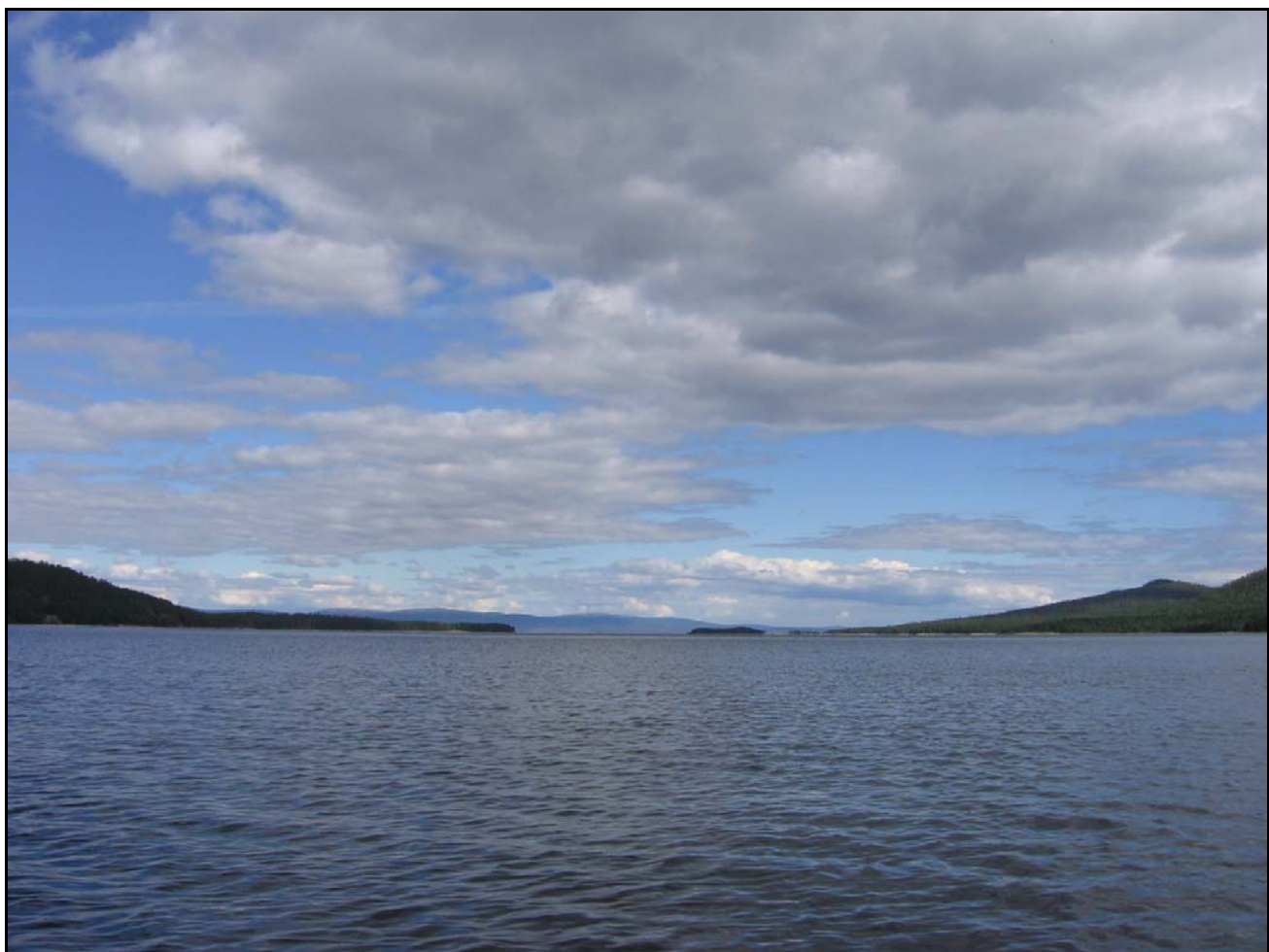
Фото 24. 3 августа. Вид из губы Княжая на восток: на Кольский п-ов (вдали), остров Крестовый (почти в центре), г.Крестовая (справа)