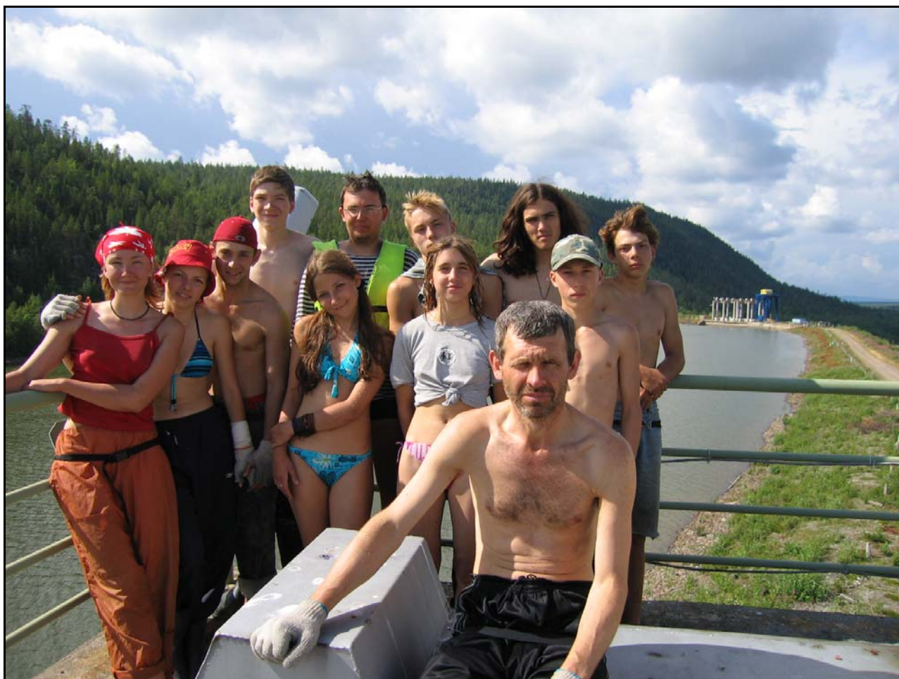
Фото 15. 26 июля. Затвор и ГЭС (плотина) Кумапорог