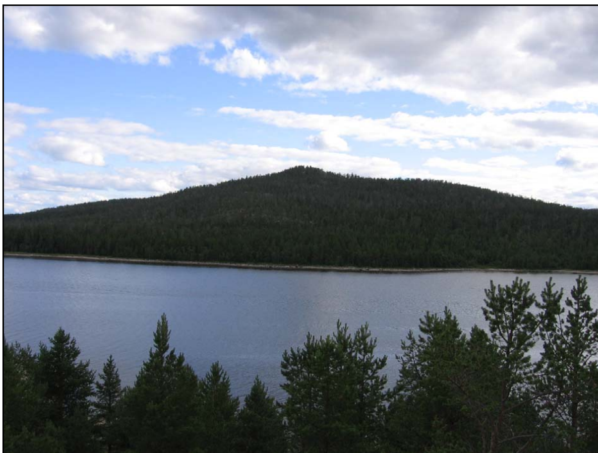
Фото 24. 3 августа. Вид на г.Крестовая (156м) с высшей точки острова Крестовый.