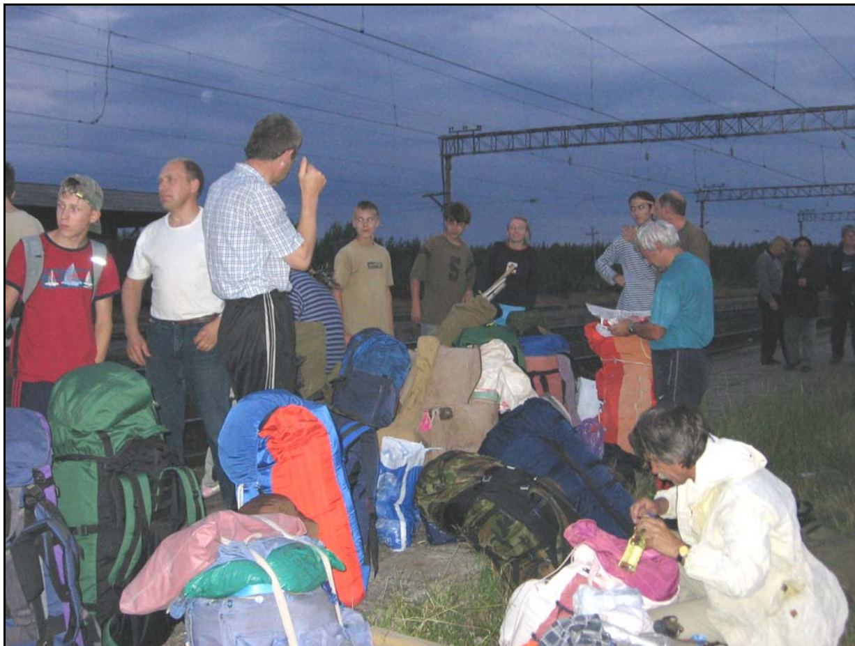
Фото 1. 18 июля. На ж.д. станции Чупа. Справа вдаль видны водители (торгуемся).