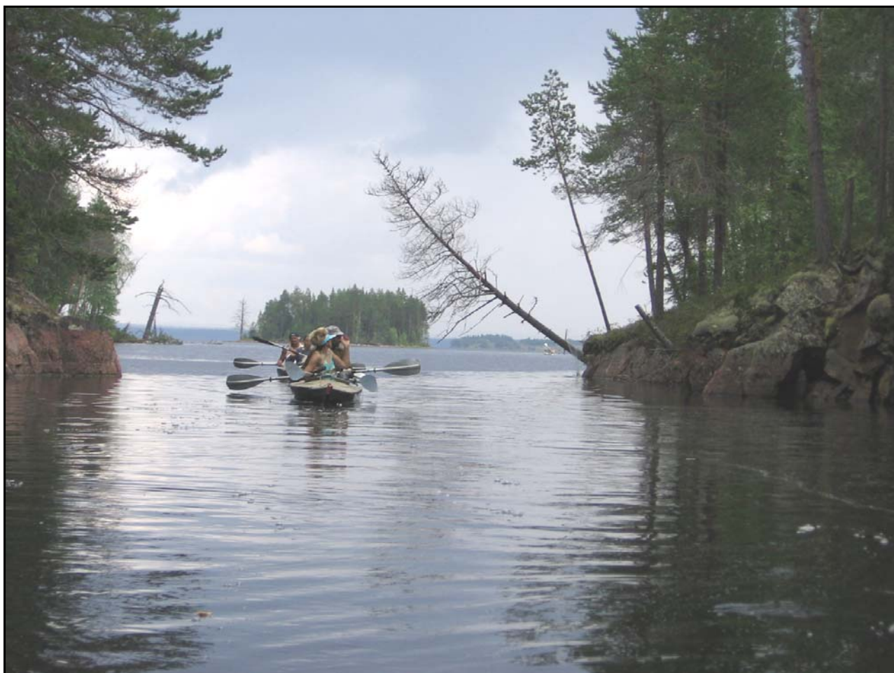
Фото 17. 28 июля. Вид из устья р.Левгус на Соколозеро. На дальнем острове видна изба Соколозеро.