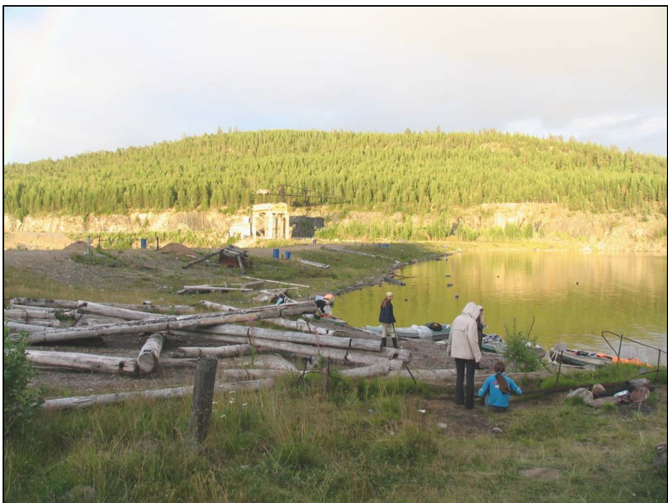
Фото 20. 30 июля. Плотина на р. Иова в пос. Зареченск.