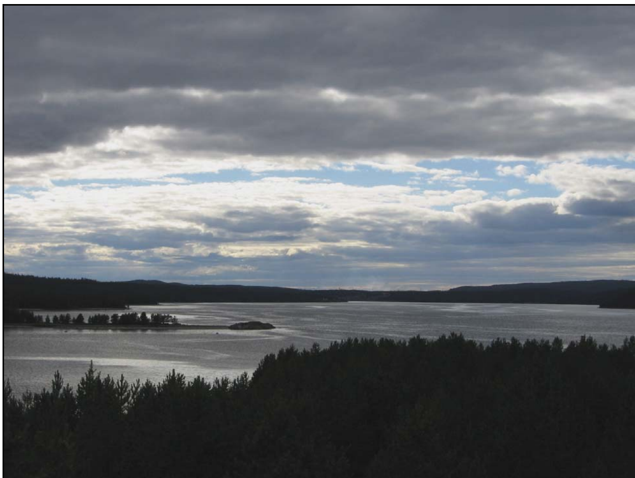
Фото 25. 3 августа. Вид на губу Княжая с высшей точки острова Крестовый.