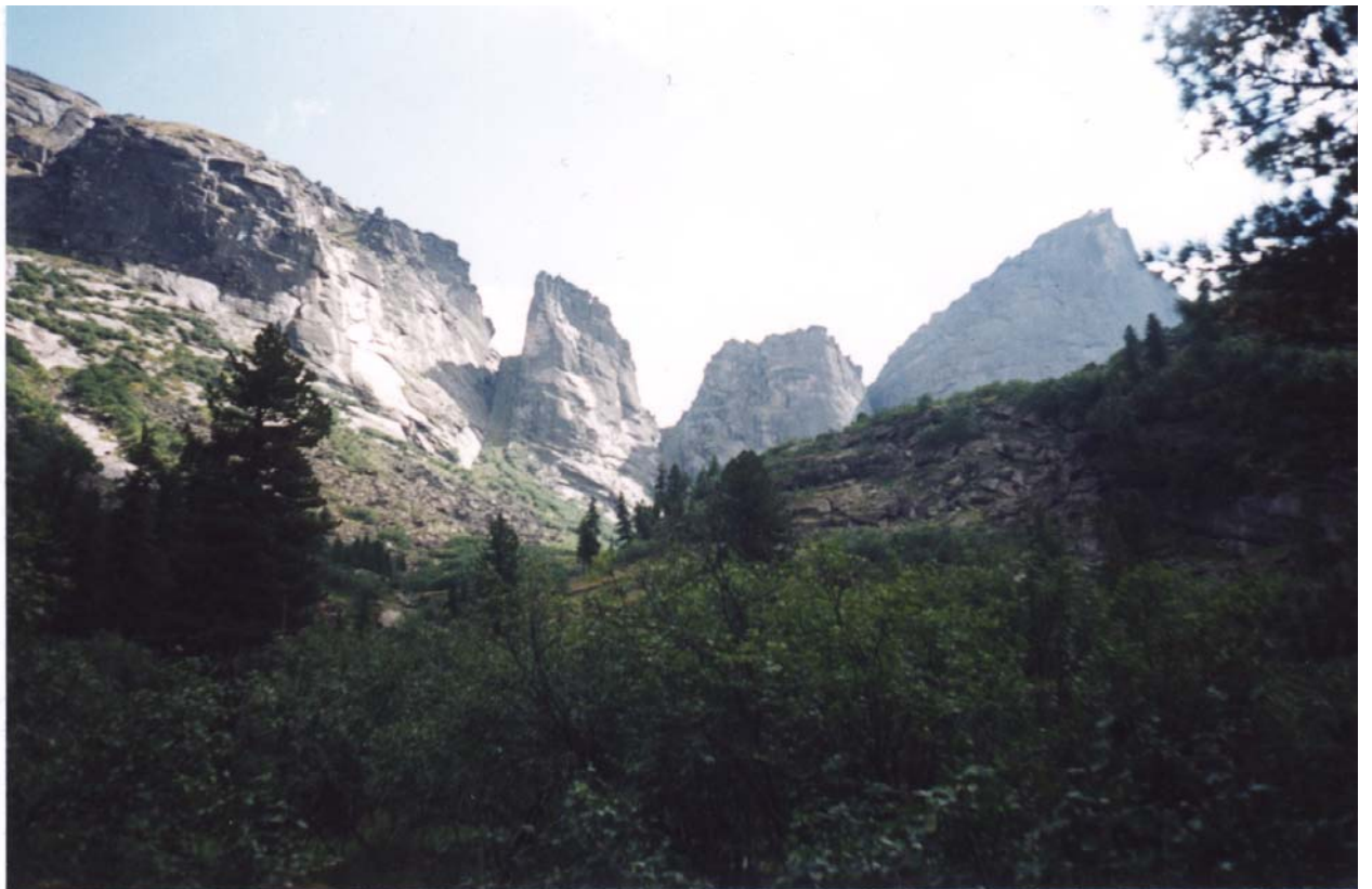
Фото 22. Пер. Близнецы (Дельфины) и Высоцкого. Слева направо: Близнецы Восточные; Близнецы Западные; Высоцкого.