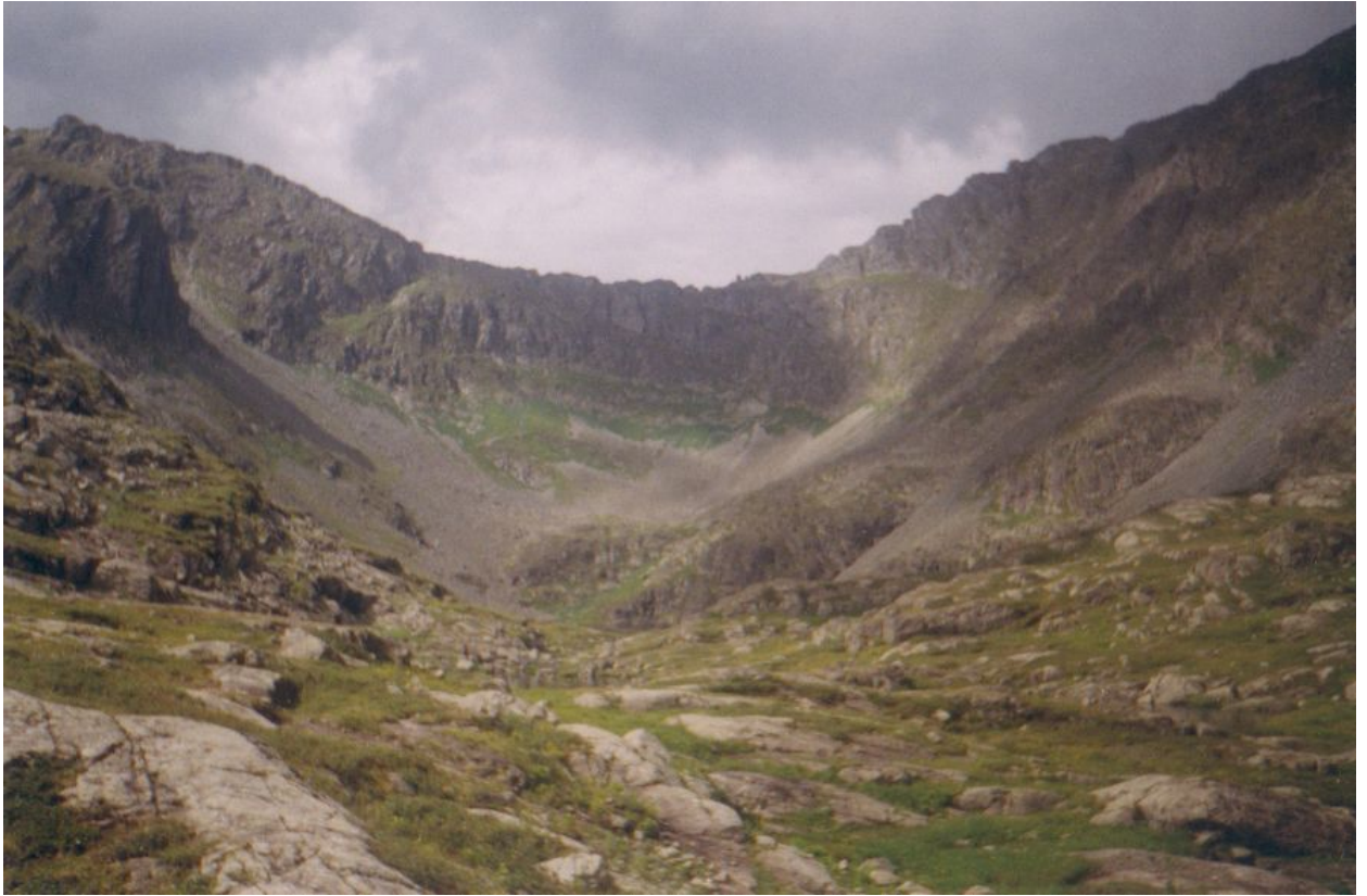
Фото 7. Часть цирка в верховьях реки М.Кара-Сук. Здесь должен быть перевал Разлом