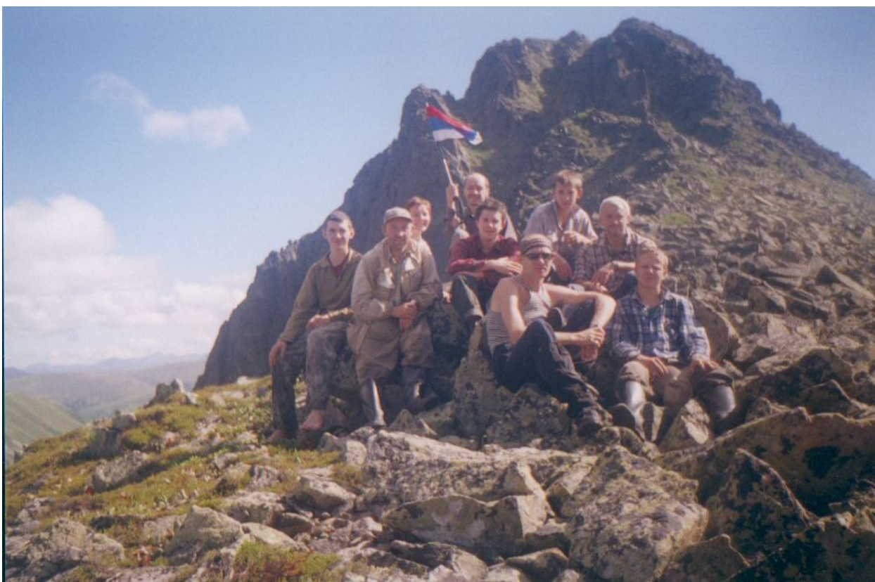
Фото 2. На перевале Прапор Юности