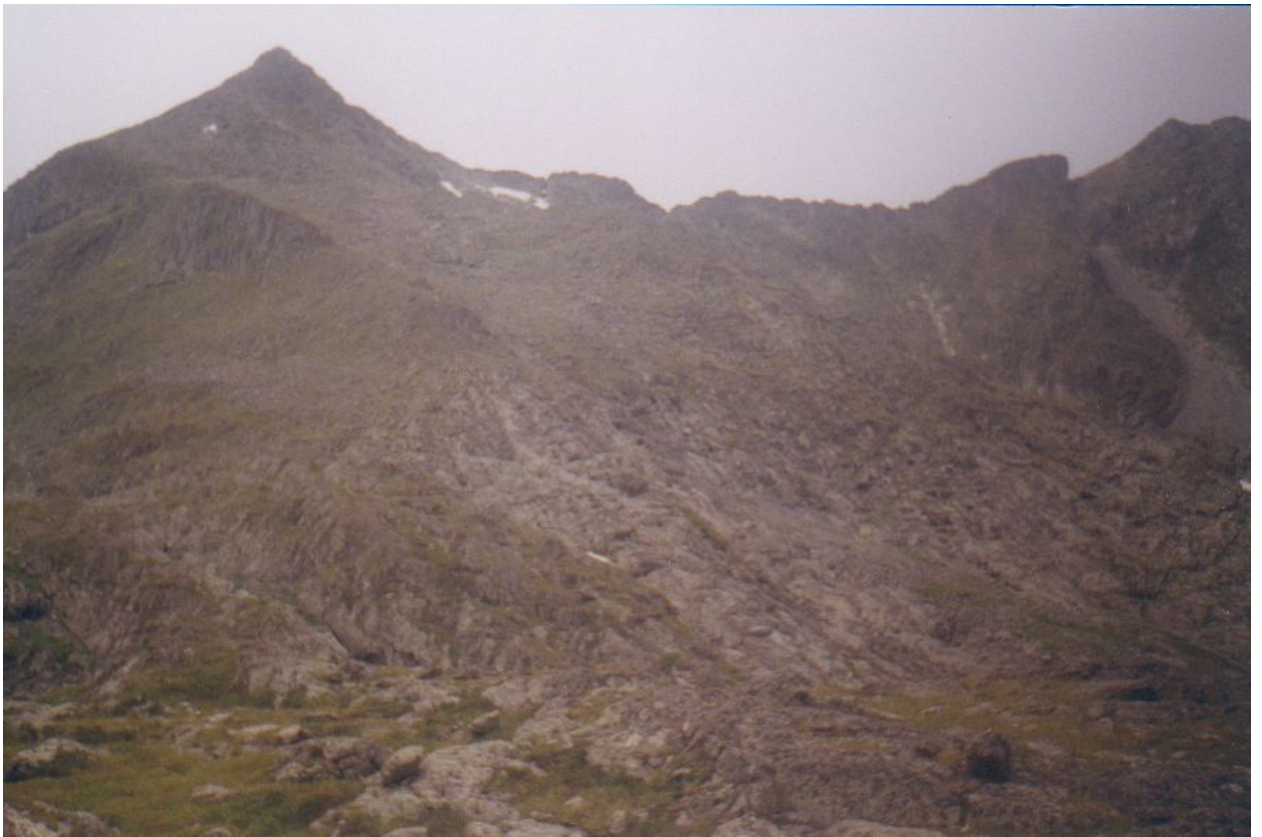
Фото 9. Часть цирка в верховьях р.Кара-Сук