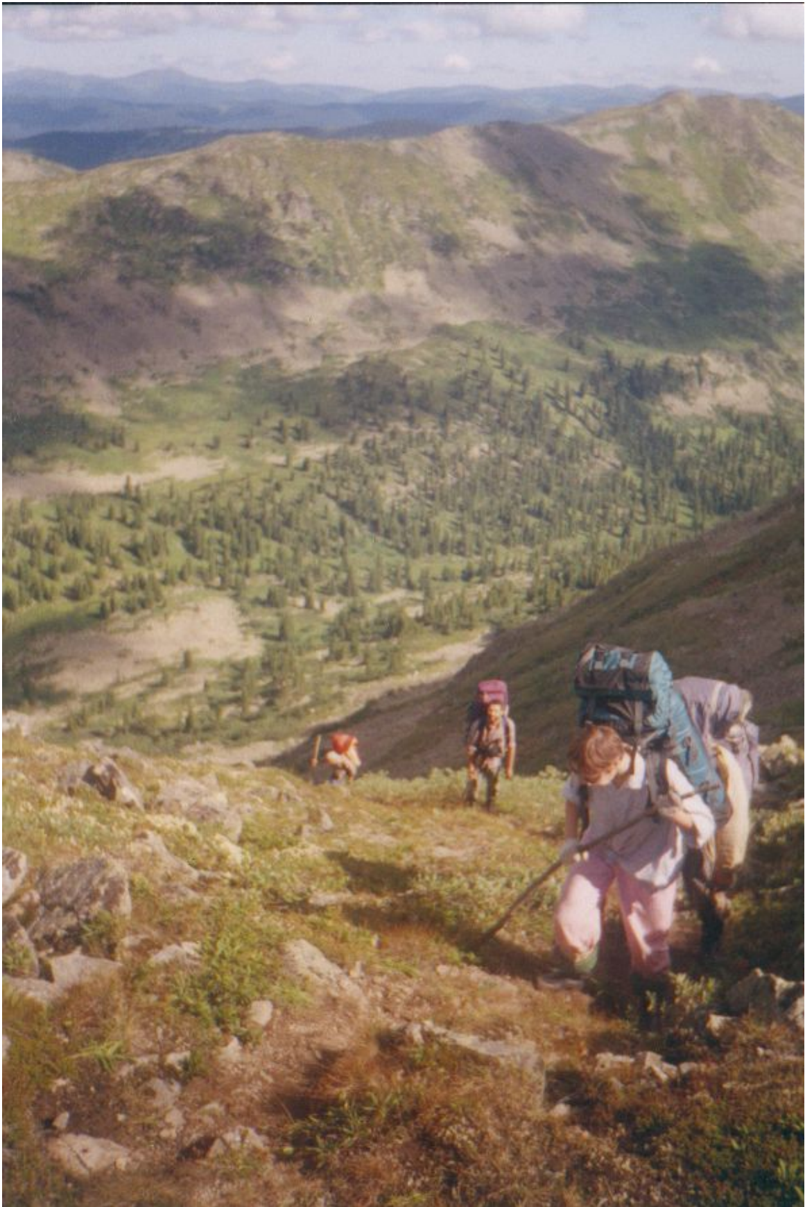
Фото 3. Последние метры подъема на перевал Прапор Юности