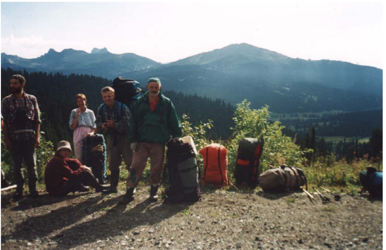
Фото 14. Начало второй части маршрута. Вдали хребет Ергаки.