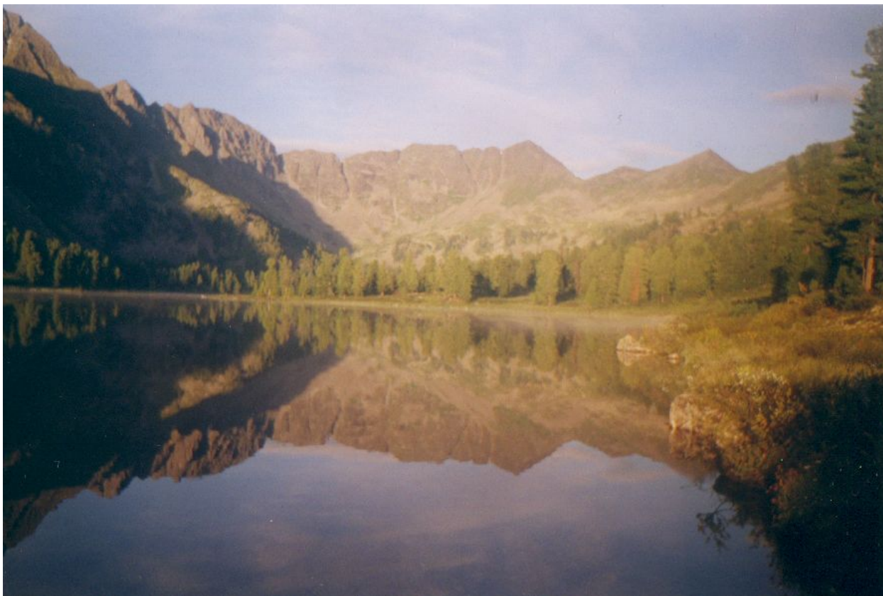
Фото 1. Озеро Красное