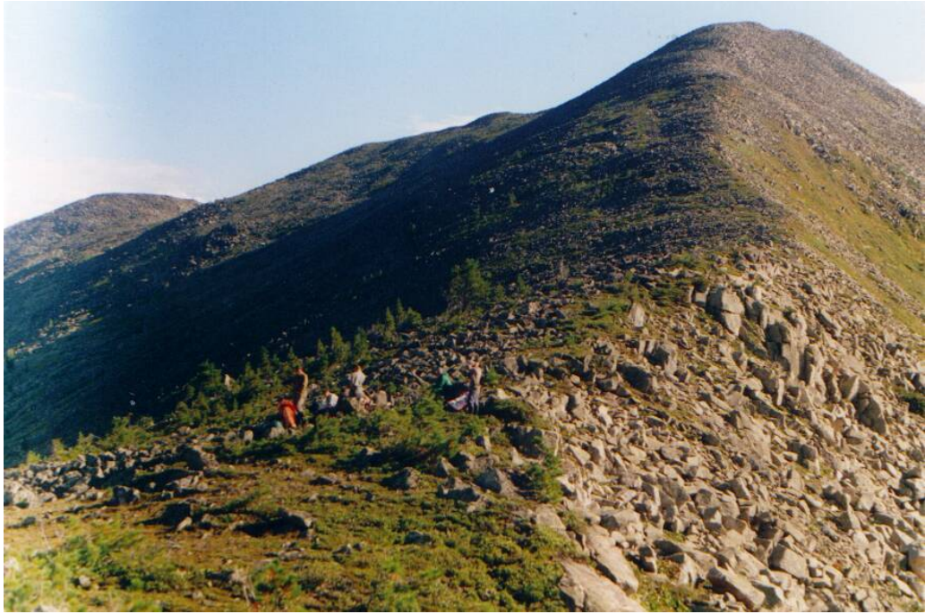
Фото 11 Группа на перевале Находка.