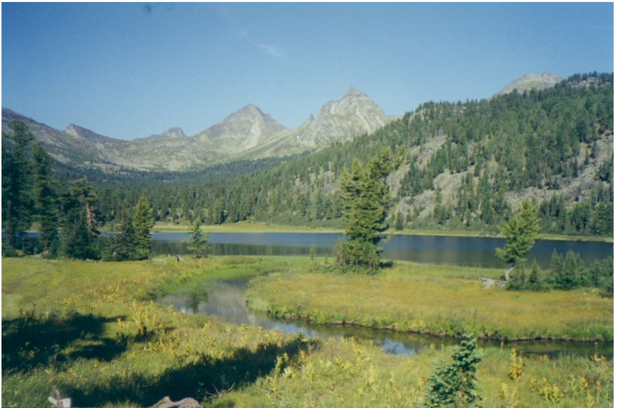
Фото 25. Озеро Безрыбное. Вдали перевалы в дол.р.Тайгиш