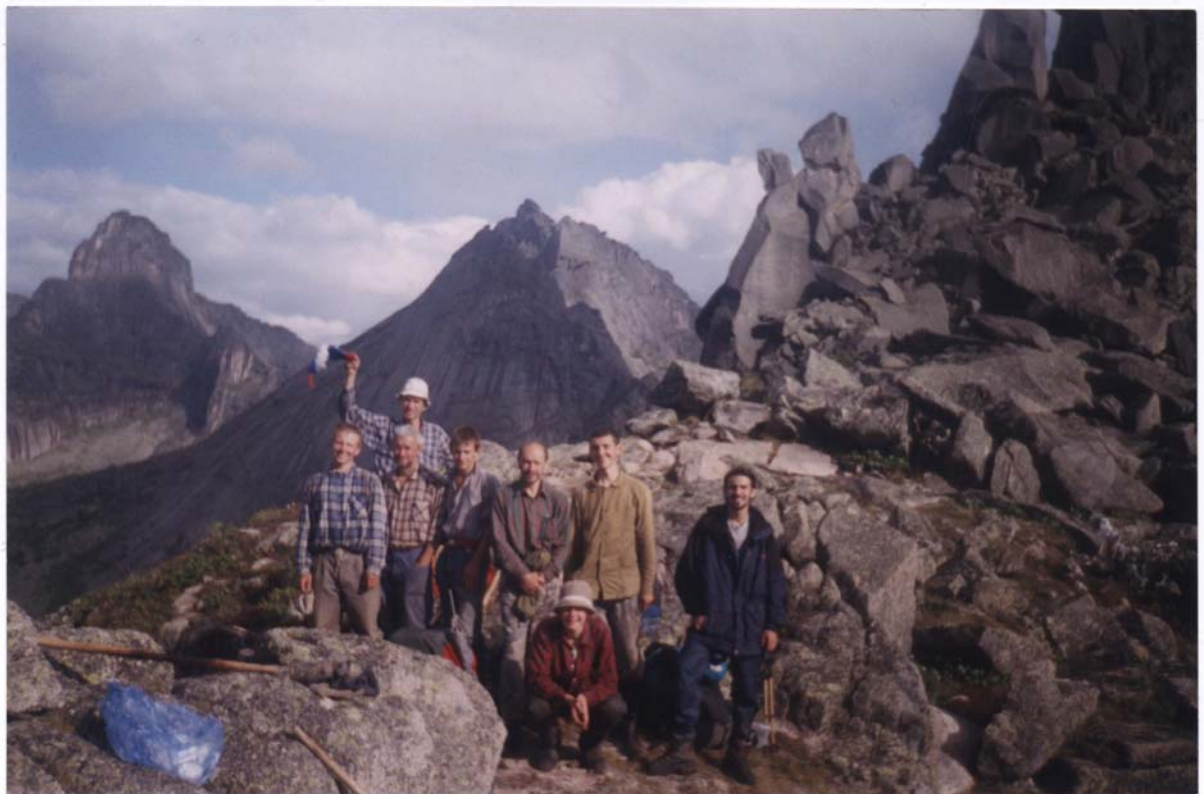
Фото 20. На перевале Художников. Вдали – пик Звёздный.