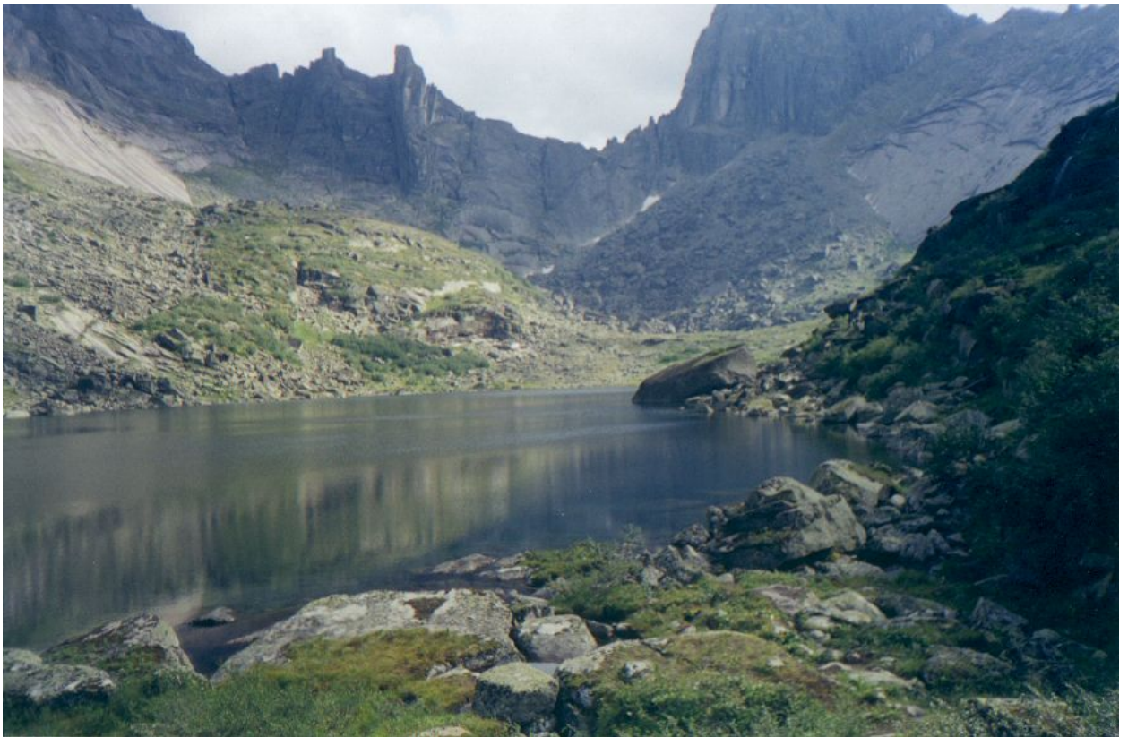
Фото 19. На озере Горных Духов.