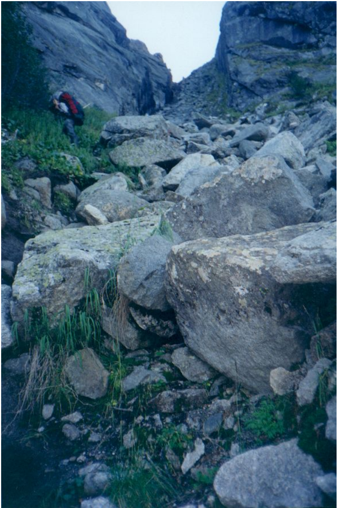
Фото 23. Подъем на перевал Близнецы Западные