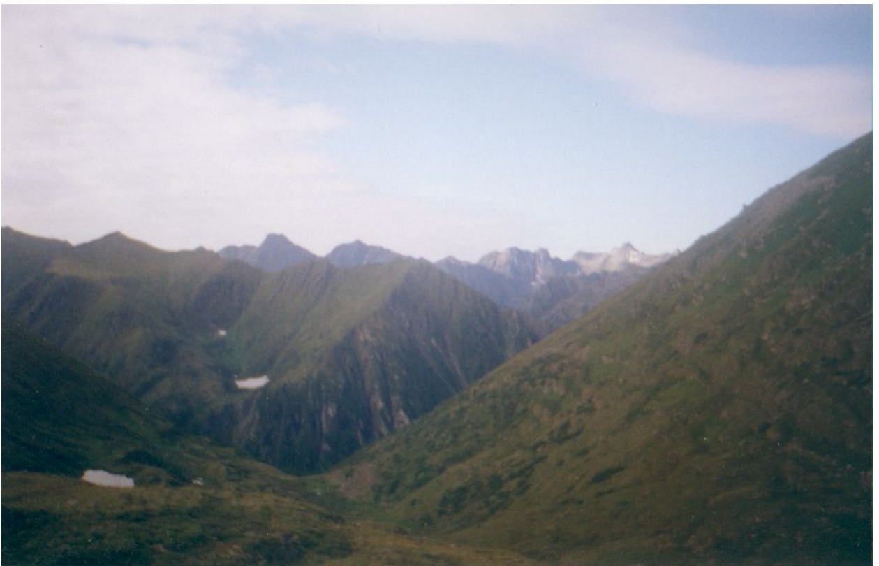
Фото 5. Вид с перевала Снежный. Вдали пик Араданский