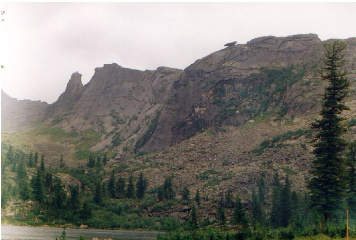
Ф.15. Висячий Камень. Вид с озера Радужного.