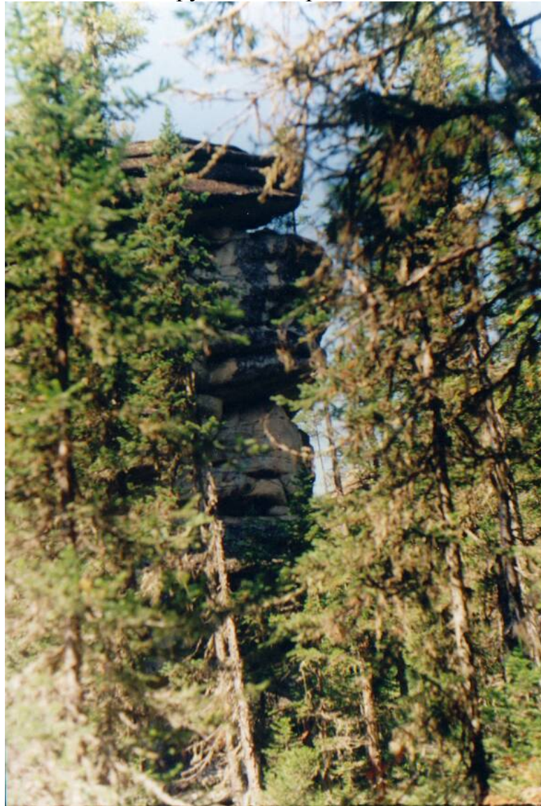
Фото 12. На подходах к Каменному Городу