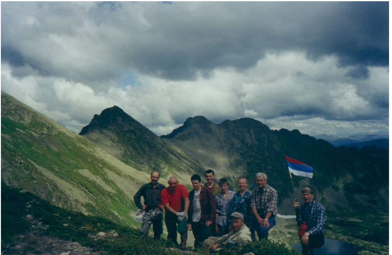
Ф. 13. На перевале в долину р.Б.Оя