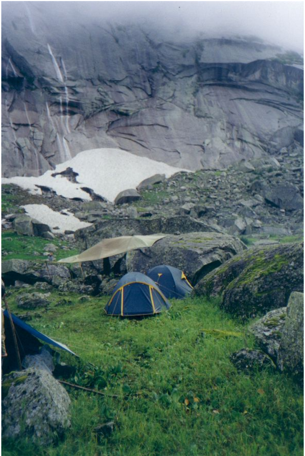
Фото 17. Ночлег на р. Левый Тайгиш