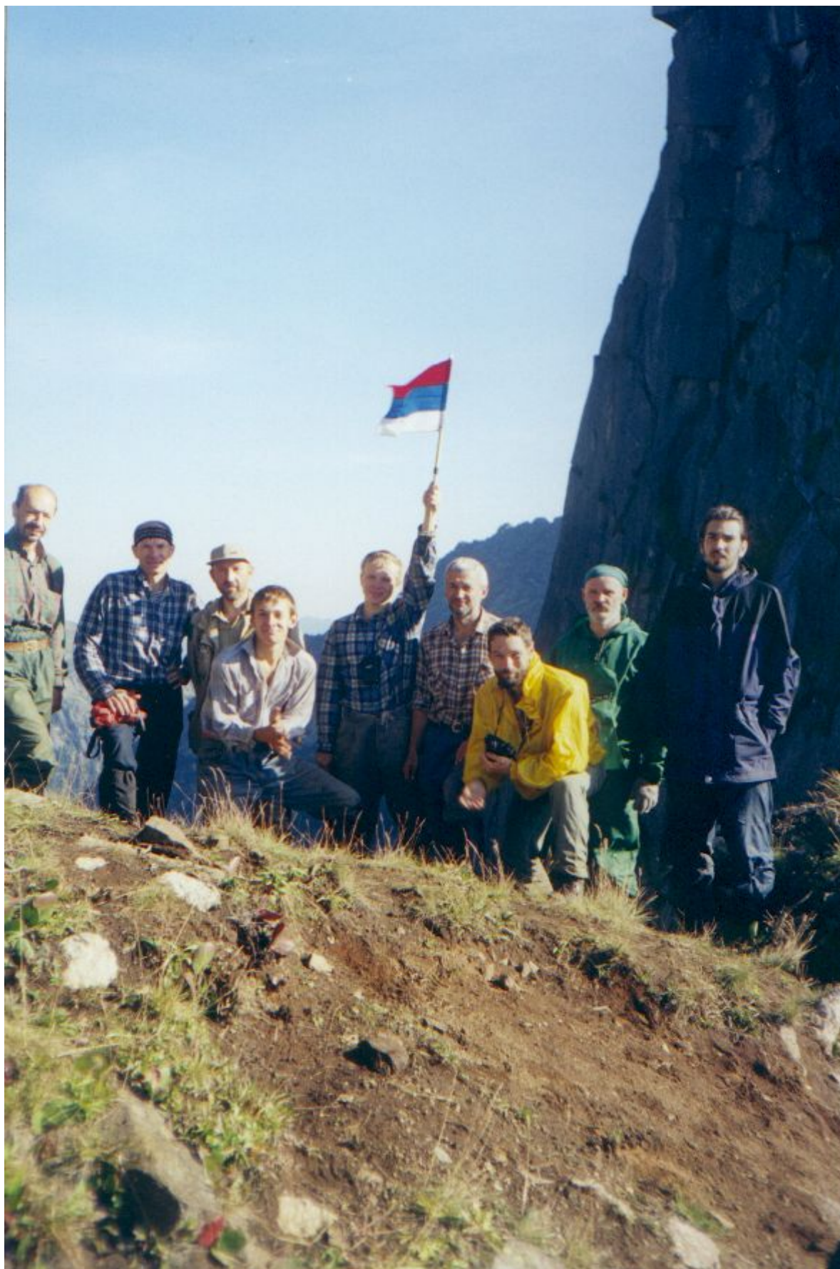
Фото 24. Группа на перевале Близнецы Западные.