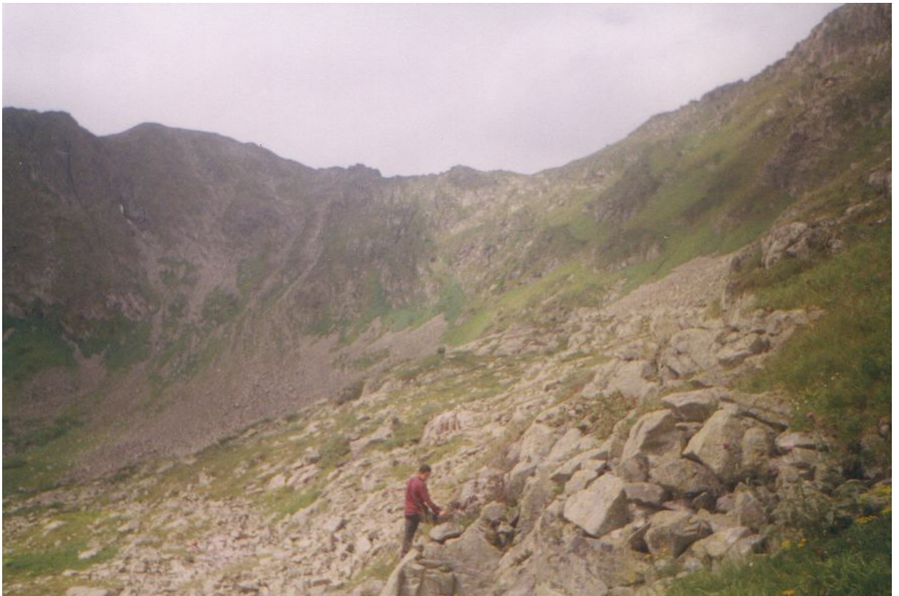
Фото 4. Панорама перевала Медвежий