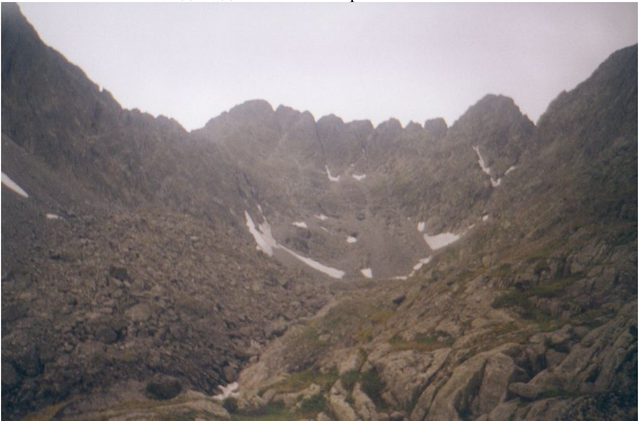
Фото 8. Часть цирка в верховьях р.Кара-Сук