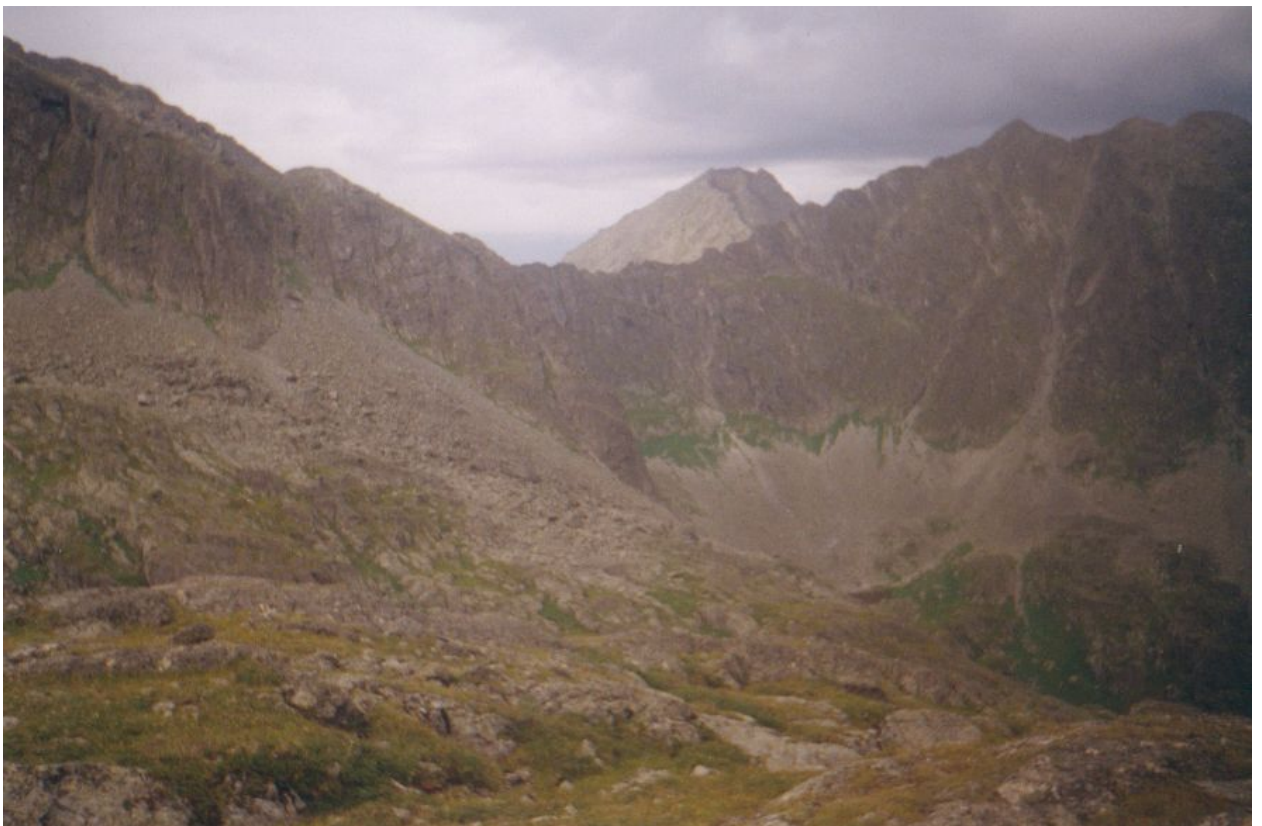
Фото 10. Один из перевалов Гребневый-?