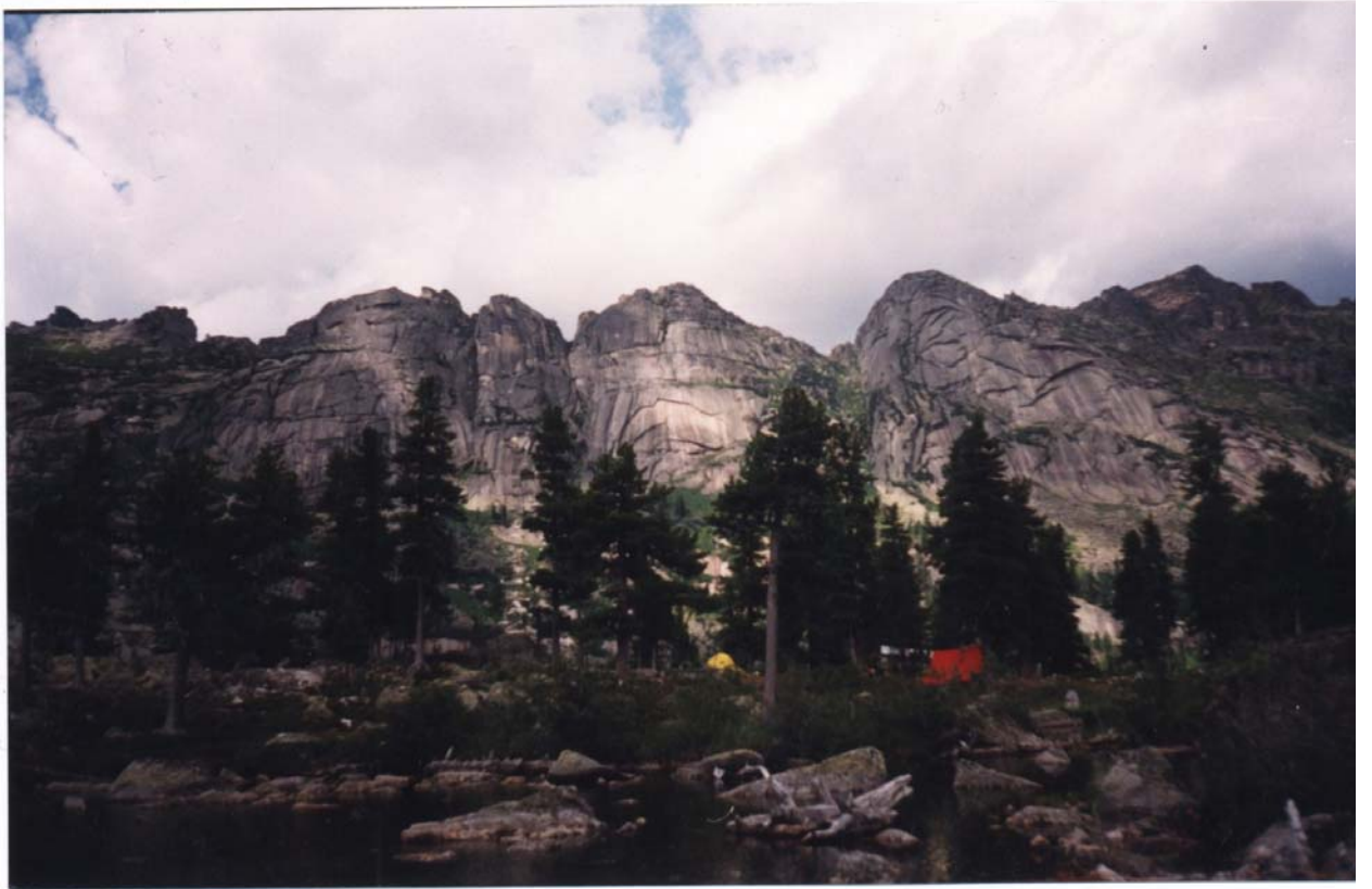
Фото 21. Группа перевалов Тайгиш. Вид с озера Художников.