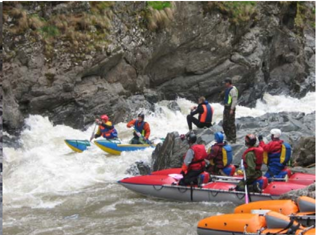
Прохождение «ПГ» экипажем «УФА-РИГ2»

Из аварий в этот день на «ПГ» (некоторые команды всеж предпочли вытягивать каты на почти вертикальный берег, чем проходить «ПГ»):