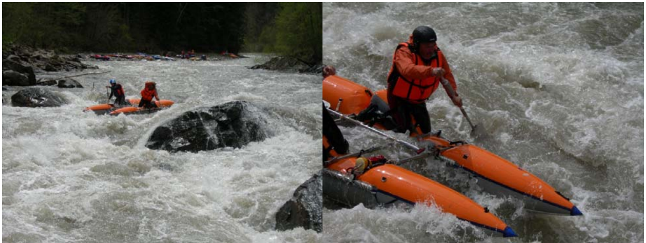
Прохождение «ПР» экипажем «Белрафт-2Т»