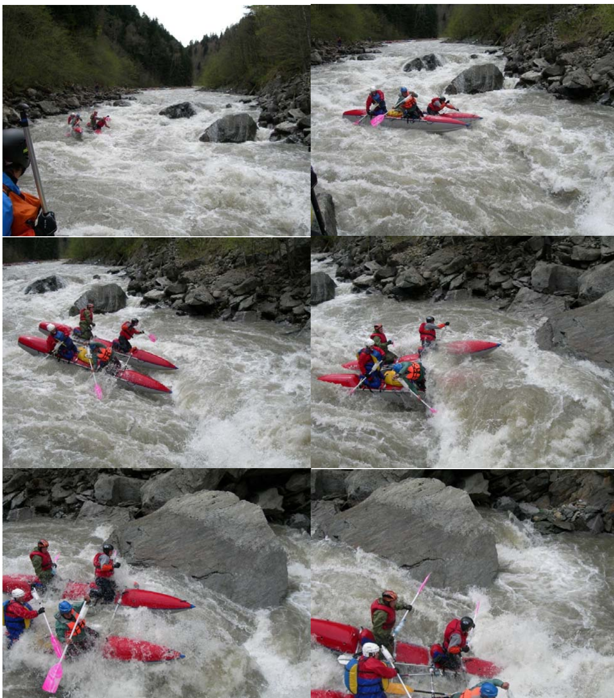
Прохождение «ПР» экипажем «Белрафт-4Т»