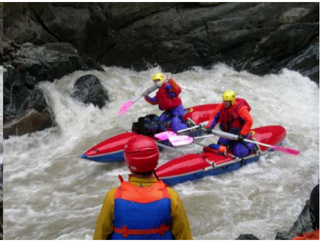
Прохождение «ПГ» экипажем «Белрафт-2ТТ»