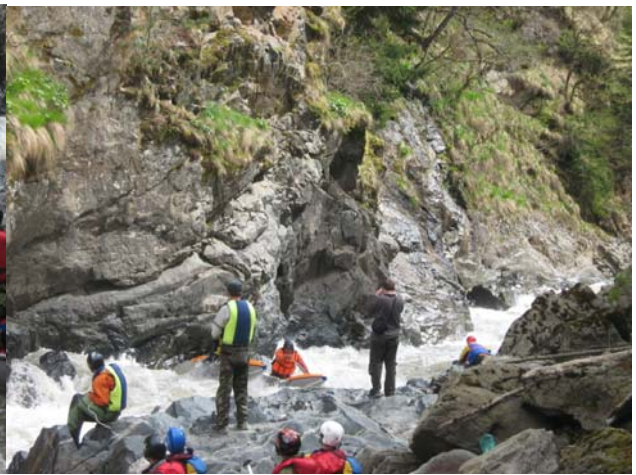
Прохождение «ПГ» экипажем «Белрафт-2Т»