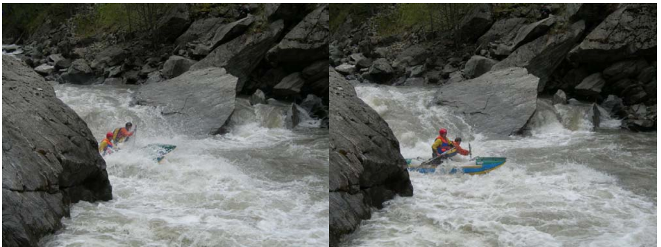
Прохождение «ПР» экипажем «УФА-РИГ2»