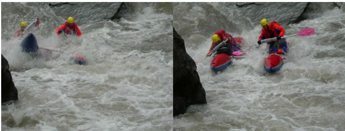
Прохождение «ПР» экипажем «Белрафт-2ТТ»