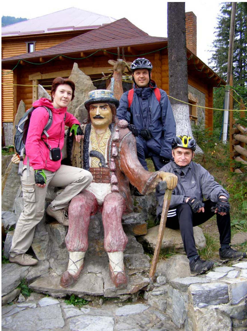
В гостях у Олеся Довбуша, легендарного героя гуцулов

одним из самых небольших в своем роде. Будучи одной из самых небольших, Ворохтянская церковь Рождества Богородицы, тем не менее, не кажется приземистой, что характерно для многих старинных деревянных храмов. Простором отличается и внутреннее убранство церкви, в которой царит уютная, деревенская атмосфера. Сохранившиеся с XIX века настенные росписи освещает проникающий сквозь небольшие окошки купола мягкий свет, благодаря такому освещению атмосфера в храме кажется еще более завораживающей, удивительной (см. сайт «otdyaem.com.ua»).